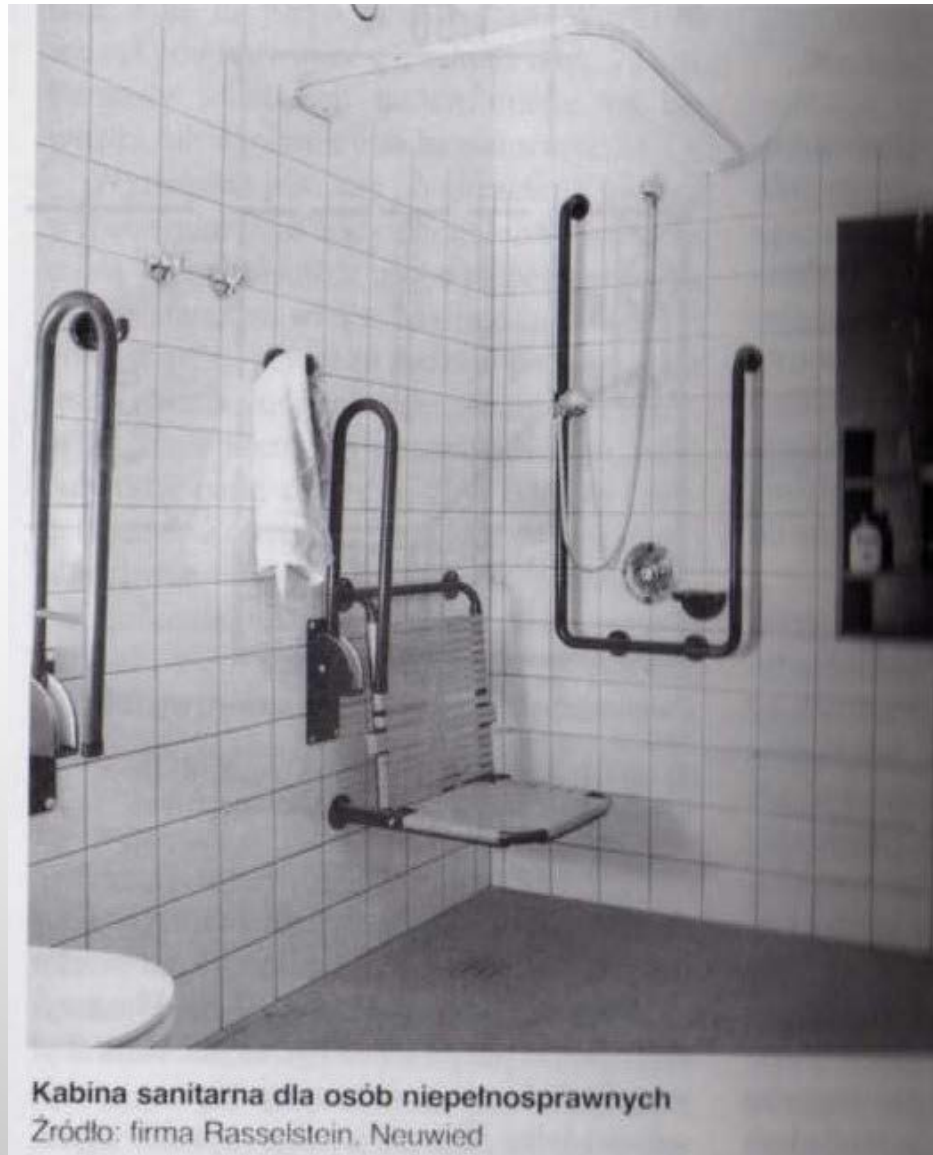
Kabina sanitarna dla osób niepełnosprawnych