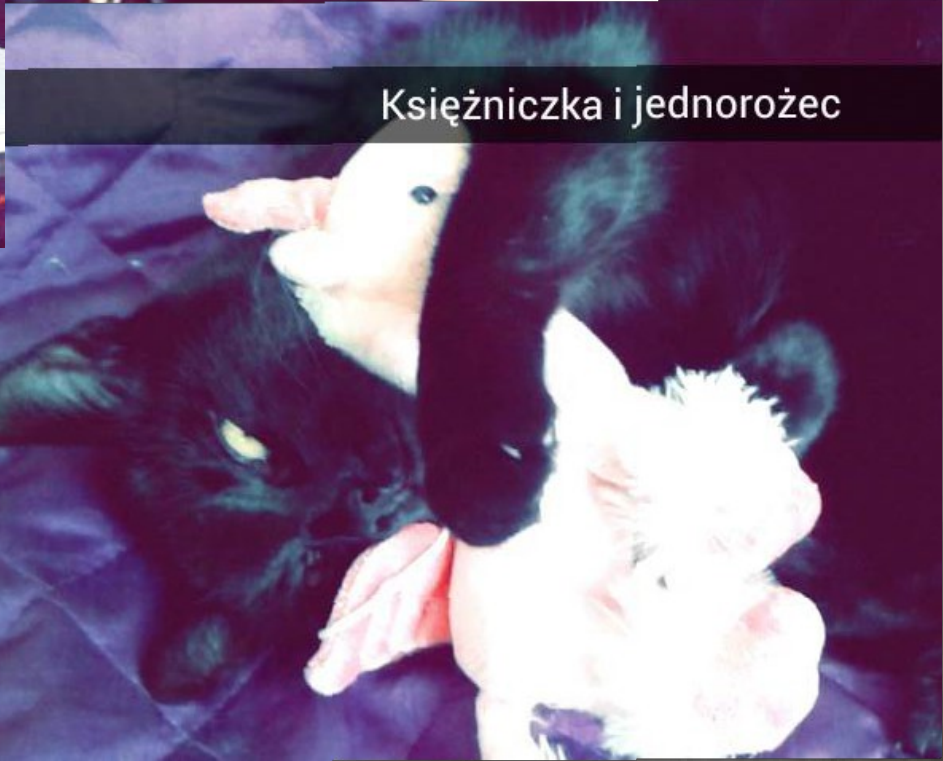
Księżniczka i jednorożec